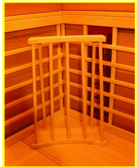
Die Bequemlehne ‚rund‘ in der Ecke einer Infrarot-Wärmekabine