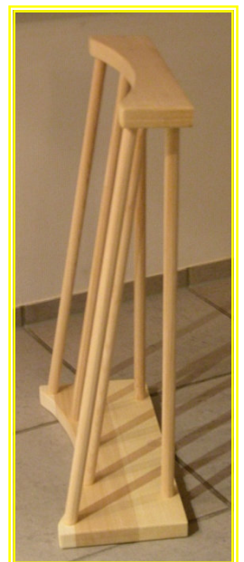
Die Seitenansicht der Bequemlehne ‚rund‘.

Maße: Höhe 70 cm (!) Tiefe unten 15 cm (Mitte) / 20 cm (Außen) – Tiefe oben 5,5 cm (Mitte) ./. 10.0 cm (Außen)