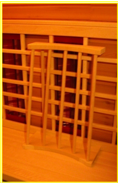
Die Bequemlehne ‚rund‘ vor einem Rückenstrahler in einer Infrarot-Wärmekabine

Entspannen Sie sich! Sie werden die Lehnen lieben!