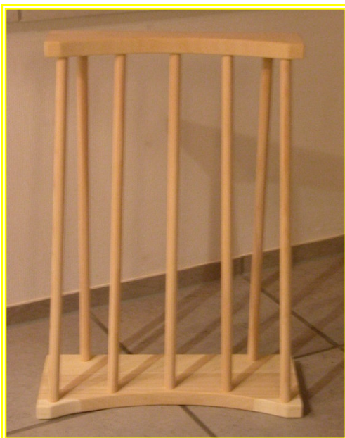
Die Vorderansicht der Bequemlehne ‚rund‘. Breite oben 45 cm, Breite unten 50 cm.